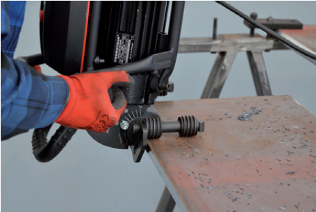
Refrentado de chapa