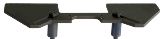
Plaquita de corte HD (1und.), en cajas de 10 unidades Referencia: PLY-000591

TToda la información aquí descrita está sujeta a cambios sin previo aviso. Rev.10 230424