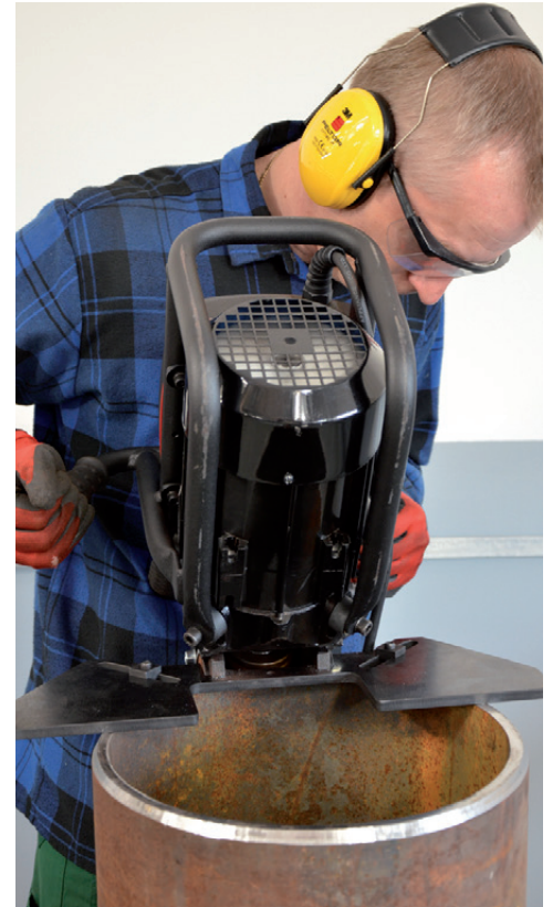
Biselado de tuberías