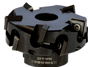
Cabezal de corte mono bloque con 10 plaquitas intercambiables fijadas con tornillos. Referencia: GLW-0461-03-00-00-0

Placa de guía universal para biselar chapas y tuberías de \varnothing 150-300mm (6-12")