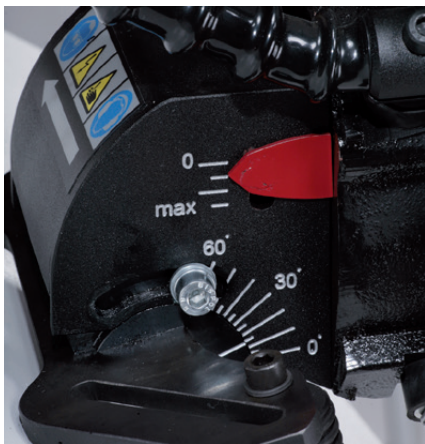
Ajuste del ángulo continuo de 0 a 60 grados.