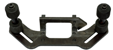
Para tuberías de \varnothing 260-600mm (10-24") es necesaria una guía opcional. Referencia: PRW-0461-22-00-00-0