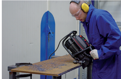
Biselado de chapa