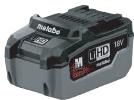
Batería Li-Ion 18V 625368000

Agregue "-KIT" al final del número de modelo para pedir un juego de herramientas, que incluye 1 herramienta, 2 baterías y 1 cargador de batería. El número de pieza también debe especificar "120 V" o "220 V", según los requisitos de alimentación.