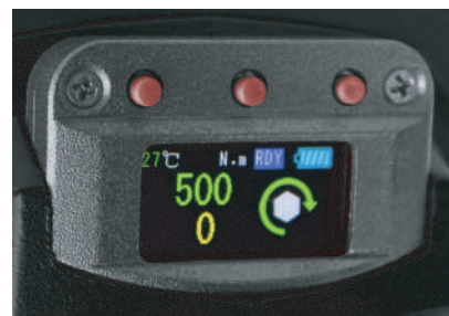
Interfaz de visualización y control digital

Comuníquese con S.G.I. Galea, S.L. para obtener más detalles, a través del correo electrónico info@galea.es o llamando al número gratuito +34 944 71 23 02.