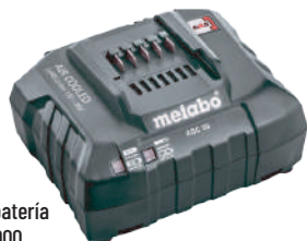
Cargador de batería 120V: 627046000 220V: 627044000